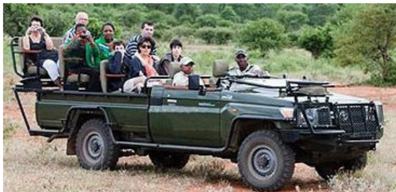
Fuoristrada da safari

La quota è preventivata considerando 6 gg di noleggio; in base agli orari definitivi dei vostri voli, calcoleremo i giorni corretti di noleggio.