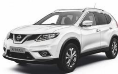
Nissan X-Trail 4x4