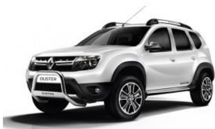
Renault Duster 4x2

I veicoli dispongono di aria condizionata e servosterzo, radio/tape, 4/5 comodi posti e un ampio bagagliaio. E' possibile comunque scegliere tra altri modelli come il VW microbus (adatto per gruppi da 6 a 8 passeggeri), oppure veicoli fuoristrada tipo Toyota Hilux 4x4 doppia cabina.